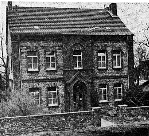
VERSTECK UNTERM DACH: Im Kirchheimer Pfarrhaus nahm der Geistliche verfolgte Juden auf.

Noch heute wird er dort im Gottesdienst verwendet, ohne daß die Kirchheimer wissen, woher er stammt. Dechant Joseph Emonds starb am 7. Februar 1975 in Kirchheim.