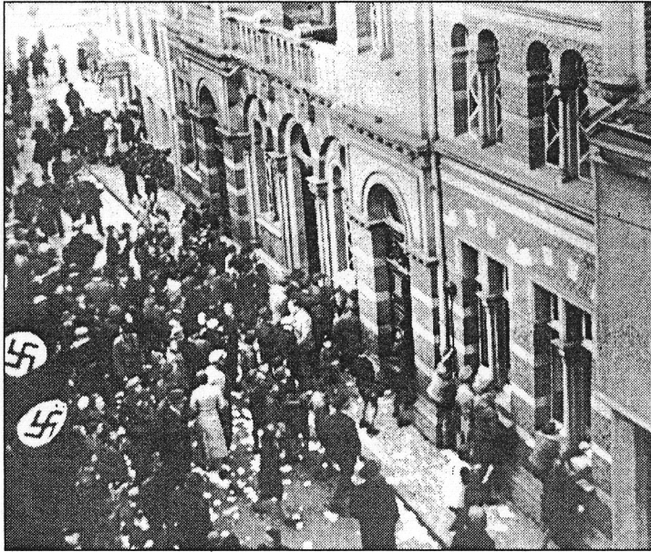
Wie überall im gesamten Deutschen Reich brannte auch in Euskirchen am 10. November 1938 die Synagoge. Einheimische mischten dabei mit.

Die Repressalien waren im Laufe der Jahre immer schlimmer geworden. Am Beginn stand der „Judenboykott“ vom 1. April 1933 gegen Geschäfte wie das damalige Eifel-Kaufhaus Tietz, am Ende die Deportation von Juden aus Euskirchen und Umgebung in die Vernichtungslager. Über diese und andere schreckliche Details aus der Geschichte der Euskirchener Juden sprach während der „Jüdischen Woche“ im Rahmen der 700-Jahr-Feier der Historiker Hans-Dieter Arntz im Alten Rathaus.